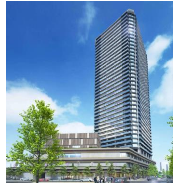
十条駅前高層タワー(地上39階地下2F 住戸数約580戸)

十条駅西口は「にぎわ いの拠点」のシンボル となる高層タワー型の 施設建築物を民間活力 により建設するととも に駅前広場や道路、駐 輪場を整備します。