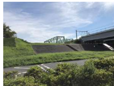
[JR東北本線荒川橋梁部の堤防]

（答）荒川氾濫の恐れがある時は高台か近隣の高層建築物への避難により災害から身を守っていただきたい、区として今後ともご協力得られる方々との協定締結を進める