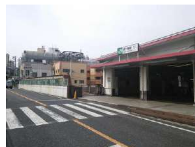
[東十条駅南口駅前]